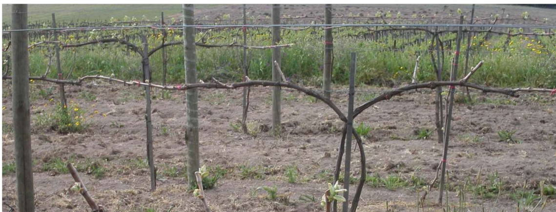
Fig. 6 – Poda à Vara