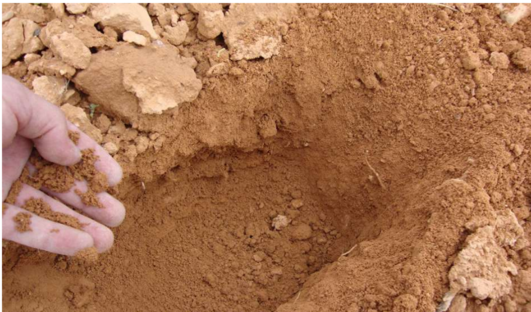
Fig. 2 – Solos litólicos de arenitos

Estas vinhas deverão estar, ou ser instaladas, preferencialmente, em solos mediterrâneos pardos ou vermelhos, normais ou parabarros de arenitos finos, argilas ou argilitos e solos calcários pardos, normais ou parabarros de margas e arenitos finos interestratificados e, ainda, em solos calcários vermelhos de margas, solos litólicos de arenitos, aluviossilos modernos e podzóis. São os solos considerados calcários, os solos mais interessantes para esta vinha.