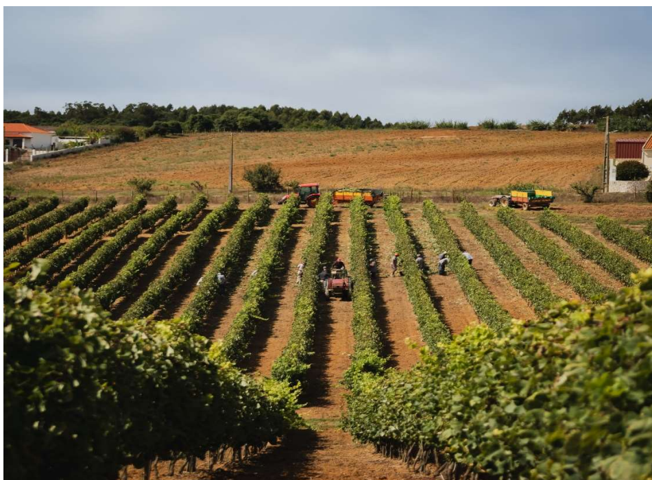
Fig. 9 – Vindimas na Região Demarcada em 2024

A vindima é efetuada normalmente em Setembro, podendo o seu período ser antecipado ou retardado, consoante as condições climáticas existentes, manual ou mecanicamente.