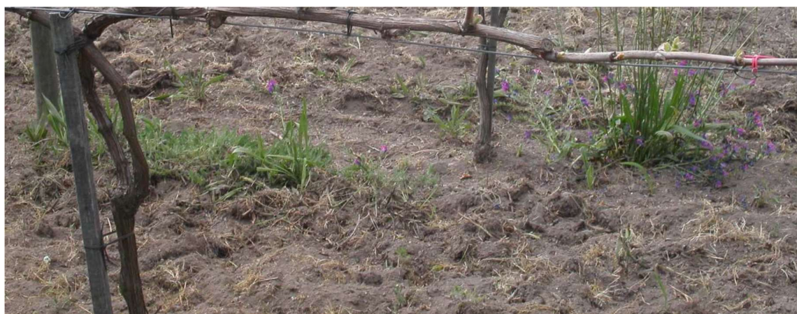
Fig. 7 - Vara guia

A poda é muitas vezes feita ao talão na vara guia ou também poderá ser feita uma poda só ao talão. A produção dum videira depende essencialmente do nº de olhos deixados à poda nesse ano, a que se chama carga. O vigor das varas de uma videira é inversamente proporcional ao seu número e as videiras com bom vigor - com varas de grossura média - são as que dão mais produção e para garantir as próximas colheitas é imprescindível manter esse vigor em toda a videira.