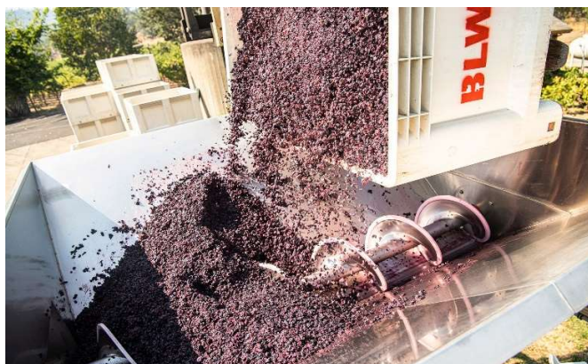
Fig. 11 – Vinificação

A vinificação é feita sem adição de anidrido sulfuroso, nem qualquer outro aditivo, e o título alcoométrico volúmico natural máximo dos vinhos a destilar é de 10 % vol.. São seguidos os métodos e práticas enológicas legalmente autorizadas e tradicionais da região. Obtêm-se, normalmente vinhos rosados, porque a percentagem de castas brancas é maioritária.