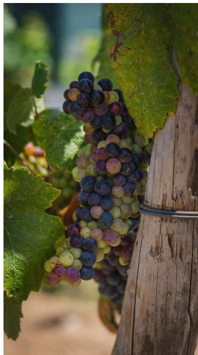
Fig. 5 – Tinta Miúda