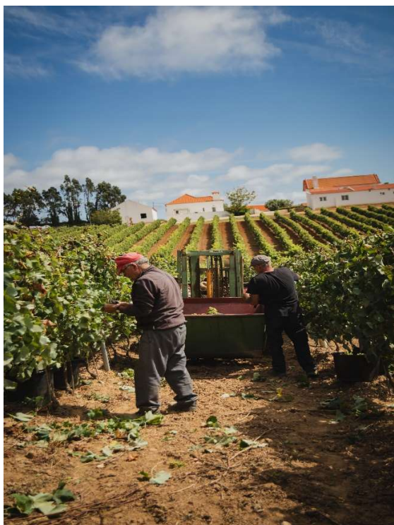
Fig. 10 – Vindima manual, 2024

As uvas são entregues em instalações parceiras da Adega Cooperativa da Lourinhã ou em instalações próprias da Quinta do Rol, normalmente com teor alcoólico na base dos 9,5%.