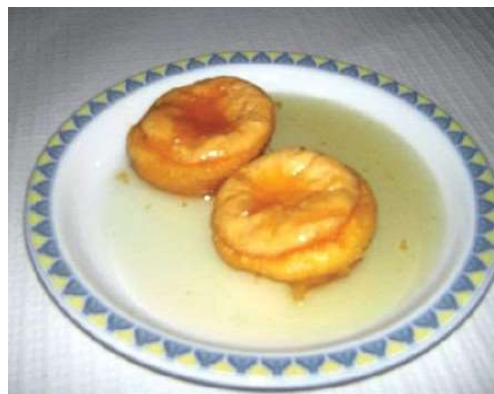
Inovações com Aguardente DOC Lourinhã