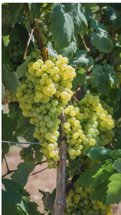
Fig. 4 – Malvasia Rei (Seminário)