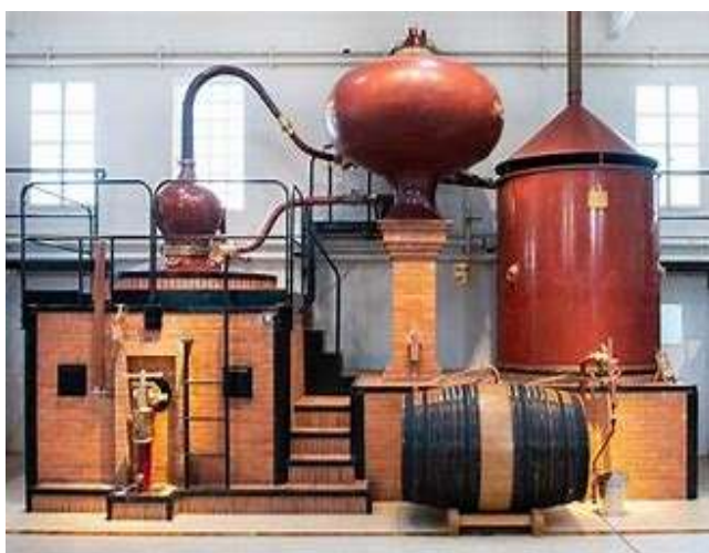
Fig. 12 – Destilação descontínua

b) Destilação descontínua, em alambique de cobre constituído por uma caldeira com capacidade máxima de 30 hl, aquecida a fogo direto, por um capitel com ou sem aquece-vinhos (esquentador) e por uma serpentina (refrigerante), sendo que numa primeira destilação é obtido um destilado com um título alcoométrico compreendido entre 27 % vol. e 30 % vol., e na subsequente destilação é obtida a «aguardente de coração» cujo título alcoométrico não pode ser superior a 72% vol.