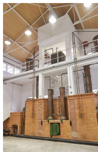
Fig. 13 – Destilação contínua

Na Região Demarcada “Lourinhã” o método mais utilizado é a destilação contínua mas também é possível realizar-se através do outro método.