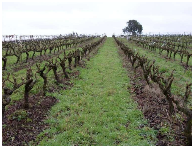
Fig. 8 – Enrelvamento em vinha

A fitossanidade é feita em Proteção Integrada, com o apoio de armadilhas e apoio técnico, no sentido de minimizar os prejuízos causados por doenças e pragas, algumas tão específicas da cultura da vinha.