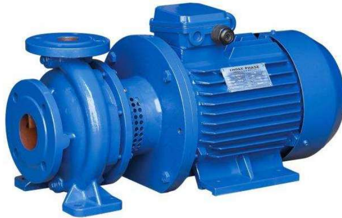
Figura 7 - Bomba de água