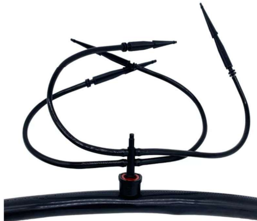
Figura 11 - Gotejador com aranha de distribuição