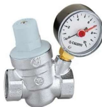
Figura 10 - Válvula reguladora de pressão