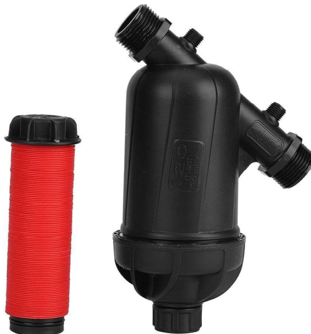
Figura 8 - Filtro de discos