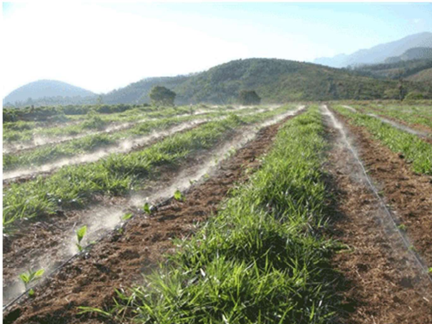
Figura 2 - Microaspersão

Uso comum: Pomares, estufas, viveiros e jardins ornamentais.