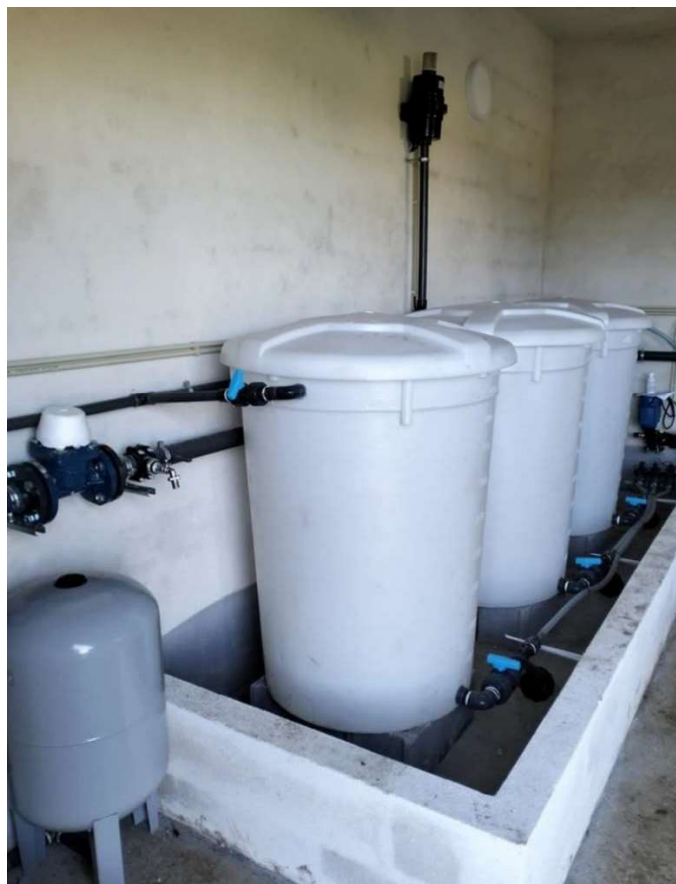
Figura 12 - Fertirrega