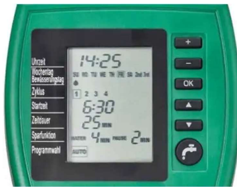
Figura 9 - Controlador de rega