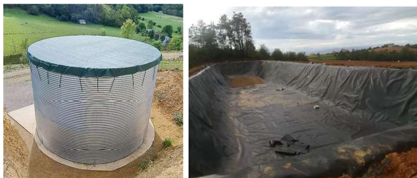
Figura 6 - Reservatório de água e charca de água