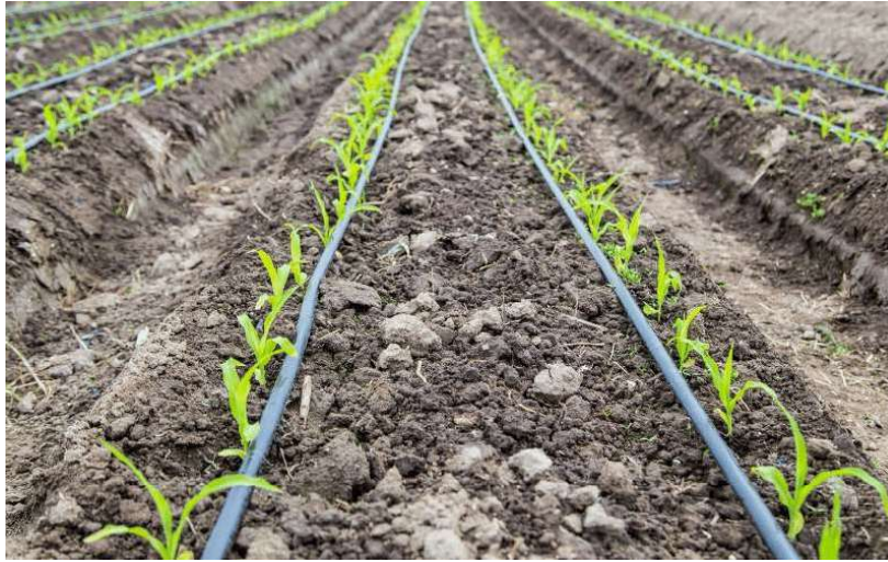
Figura 3 - Mangueiras de gota-a-gota

Uso comum: Produção de hortaliças e grãos.