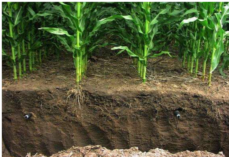
Figura 4 - Gotejamento subterrâneo

Uso comum: Relvados, campos desportivos e áreas paisagísticas, além de culturas agrícolas de longa duração.